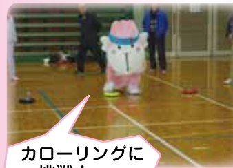
カローリングに挑戦！

こんにちは！ゴールデンウィークはゆっくり出来たかな？「おごりん*」はSLをお見送りしたり、維新公園のイベントでたくさんお友達に会ったよ♥春ってたくさん出合いがあるんだね。みんなは新しいお友達にできたかな？そういえば、もうすぐ梅雨だね。「おごりん*」は傘