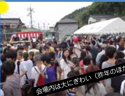
会場内は大にぎわい (昨年のほたる祭り)

今年もほたるの季節がやってきました。四十八瀬川沿いにある、新町西公民館を主会場に6月7日(土)にほたる祭りが開催されます。スターライトのバンド演奏や、ダンスなど多彩なステージイベントが催されます。またバザー会場では、焼きそば・焼き鳥、かき氷などのコーナーが設けられ、子どもから大人まで楽しめますのでみなさん是非お出かけください。